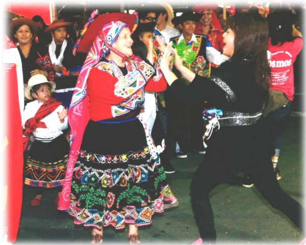
2014優秀賞「感激の出会い」