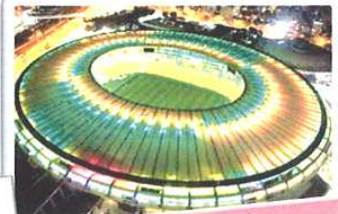
マラカナンスタジアム