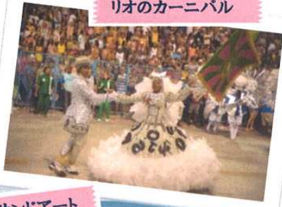
リオのカーニバル