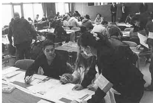
外国人市民で賑わった税務相談会の様子

同相談会を実施して10年以上が経ち、外国人の間でも口コミで評判が広がり、両日あわせて241件(ブラジル人161人、フィリピン61人、ペルー15人、他4人)が相談会に参加。また、行政書士・弁護士による無料相談会も同時開催しました。