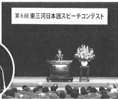
第6回 東三河日本語スピーチコンテスト