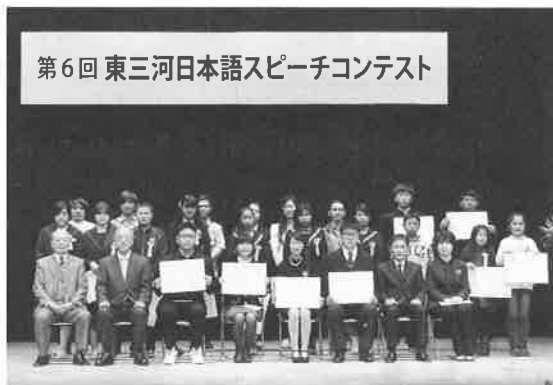
出場者と審査員の皆さん

去る1月17日(日)豊橋市公会堂で、東三河5市国際交流協会と同コンテスト実行委員会が主催する「第6回東三河日本語スピーチコンテスト」が開催されました。