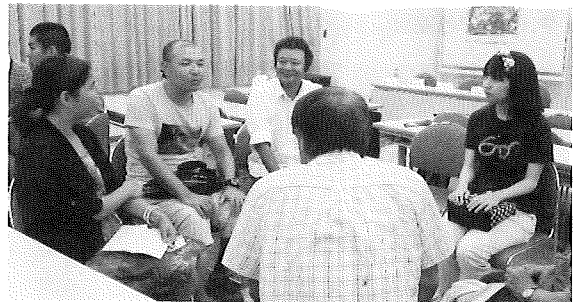
JICAボランティアOB交流会の様子

興味ある方、あるいは「協力隊OBの体験談をして欲しい」という、ご要望がありましたら、ご連絡ください。