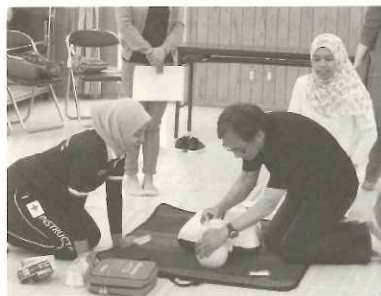
6/11 やさしい日本語での救急法講習の様子