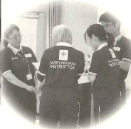
赤十字指導員と綿密な打ち合わせ