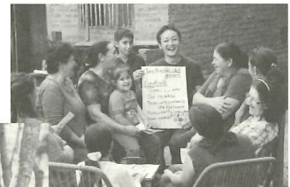
任国バラグアイにて

詳細はJICAウェブサイトをご覧ください。https://www.jica.go.jp/volunteer/