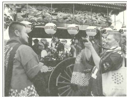
都筑和雄「祭りを切る」