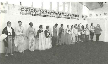
民族衣装ファッションショー