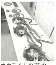
ウクライナの花のカチューシャ