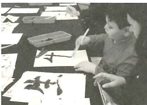
世界文化体験(書道)