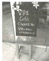
世界文化体験(留学生カフェ)