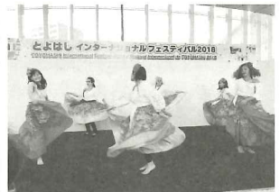
ブラジルダンス「カリンボー」