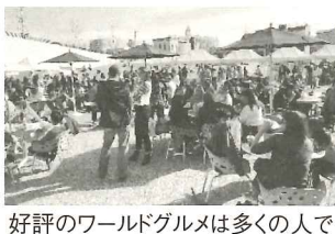
好評のワールドグルメは多くの人でにぎわいました