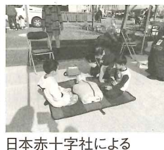
日本赤十字社によるAED体験