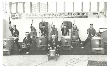
躍動感あふれる豊丘高校和太鼓部