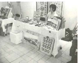
フェアトレードバザー