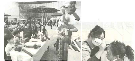
子どもたちに大人気のフェイスペイントとバルーン