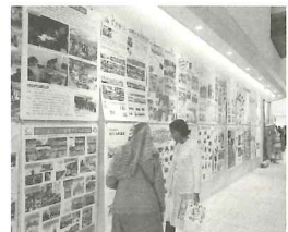
国際交流団体の活動紹介