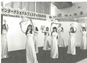
ベトナム民族舞踊