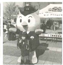
豊橋警察署コノハ警部