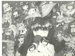
「絵画は、私の 幸せの源です」 ベアトリス・アユミ・ヒラタ