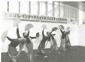
フィリピン民族舞踊