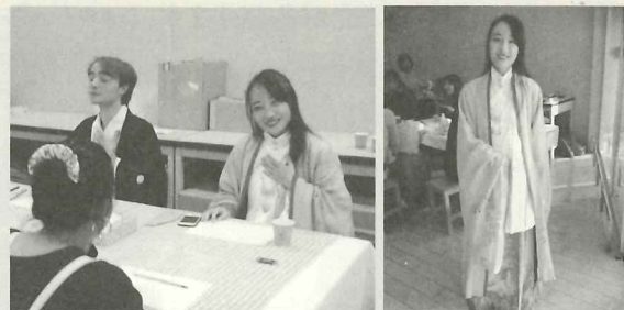
「とよはし国際フェスティバル」にて