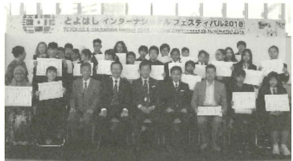
協賛：豊橋みなとライオンズクラブ

まだまだ好きな日本語がおびただしい数ありますが、今日はここで終らせて頂きます。皆さん、ご清聴ありがとうございました。