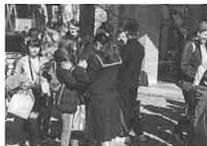
ホストファミリーとのお別れ