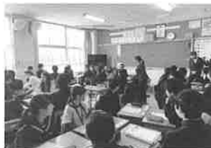
羽田中学校での授業体験

3月中旬の6日間、中学生海外派遣事業で相互交流を進めているヴォルフスブルグ市、ホフマン・フォン・フェーラーズリーベン実科学校の生徒の皆さんら27名が豊橋を訪れました。3泊4日のホームステイでは、昨年10月に同市を訪問した豊橋の中学生が中心にホストファミリーとなり、更なる交流を深めました。