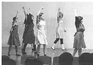
歓迎会でダンス披露