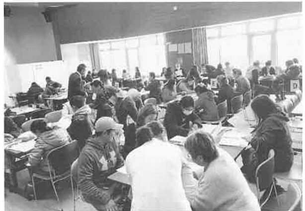
外国人市民で賑わった税務相談会の様子

16回目となる同相談会は外国人の間でも口コミで評判が広がり、両日あわせて307人(ブラジル人156人、フィリピン人135人、その他16人)が相談会に参加しました。近年、フィリピンの相談者が増加しています。