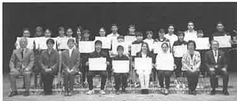
出場者と審査員の皆さん