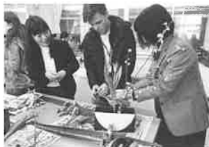
家政高等専修学校では生け花を