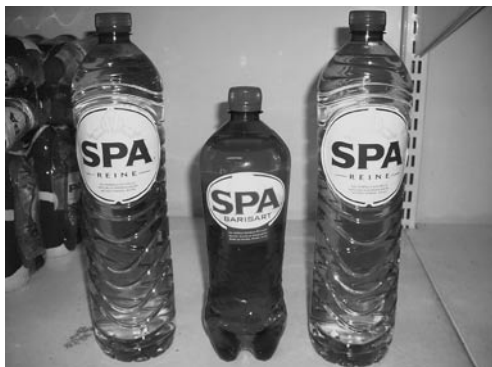
中央が赤ラベル、両脇が青ラベル

でも冬はやっぱり温泉が一番、と思うのは私だけだろうか。で、ベルギーに温泉はというと・・・あった、あった。その名も“SPA(スパ)”。でも日本みたいに熱湯が湧いているわけではない。ほんのり人肌程度といったところ。でもこっちは日本人みたいに熱い湯に入らないのでこれくらいがちょうど良いのだろう。もっともこのSPAはミネラル飲料として有名。赤ラベルと青ラベルがあって、赤はガス入り、青はガスなし。私は目下のところ“spa rood(赤)”がお気に入り。