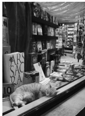
本屋さんもバーゲン中 猫は冬眠中(笑)

「クリスマスマーケット!」と答える。確かにヨーロッパのクリスマスは美しい。ただでさえおとぎの国にいるみたいなのに、色とりどりのイルミネーションに飾られた夜のクリスマスマーケットはまるで幻想的な別世界。でも待てよ。クリスマスマーケットはせいぜい1月の初めまで。じゃあ、そのあと何するの?「クリスマスが終わったら?はは、あとはクマみたいに冬眠するだけさ!」