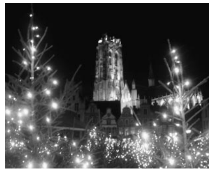
メヘレンのクリスマスマーケット

寒さの苦手な私は、なかなか冬の楽しみが見つけれない。そこでベルギー人に冬の一番の楽しみは何かと尋ねてみた。クロスカントリー、スノーサーフィン、スープにホットチョコレート、ショッピング。でも誰もが真っ先に